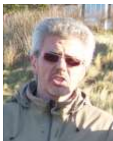
Par Vincent Pfertzel

Je prie que cette magnifique œuvre qu'est celle du CDJ puisse être connue comme un centre qui relève l'ensemble de ces défis humains, matériels, pratiquant le pardon lorsque cela est nécessaire, pour encore et toujours faire rayonner l'amour de Jésus-Christ dans nos vies.