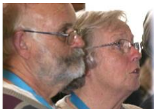
Par Christine Monclair

Mais pour moi tout n'est pas terminé : je peux accompagner tous les actifs au CDJ dans mes prières ! Je prie que Dieu veille sur tout ce qui se fait au CDJ, en particulier pendant les camps d'été, que sa main puissante et protectrice accompagne toutes les activités, et que chaque participant reparte ayant rencontré Dieu !